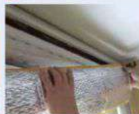
4 Cajón de persianas