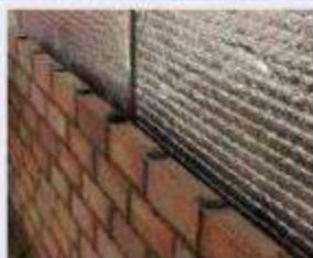
2 Paredes y trasdosados