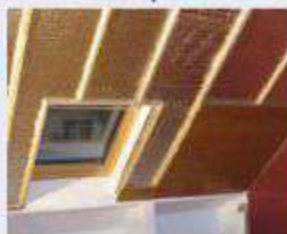
1 Techos y buhardillas