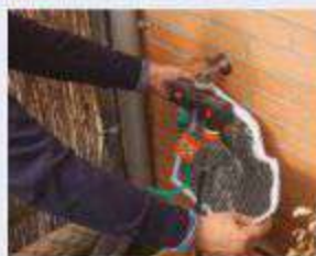
3 Contadores de agua