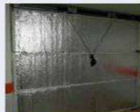
6 Puertas de Garaje