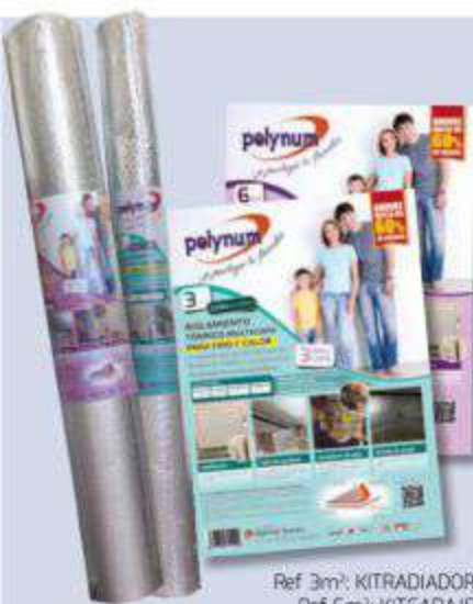
Ref 3m 2 : KITRADIADOR Ref 6m 2 : KITGARAJE

Compuesto por dos láminas externas de aluminio (100%) y una capa de burbuja de aire de polietileno. Impermeabilidad total y seguro para personas y animales. Anticorrosivo contra agua y humedad. En dos formatos: 3 m 2 y 6 m 2 .